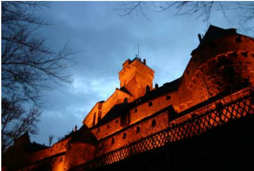
Photo : Au pied du château la nuit

Dominant la plaine à 757 mètres d'altitude, le château du Haut-Koenigsbourg est une forteresse construite au XII e siècle, reconstruite et modernisée à la fin du XV e siècle. Vous l'avez vu dans La Grande Illusion, le chef d'oeuvre de Jean Renoir.